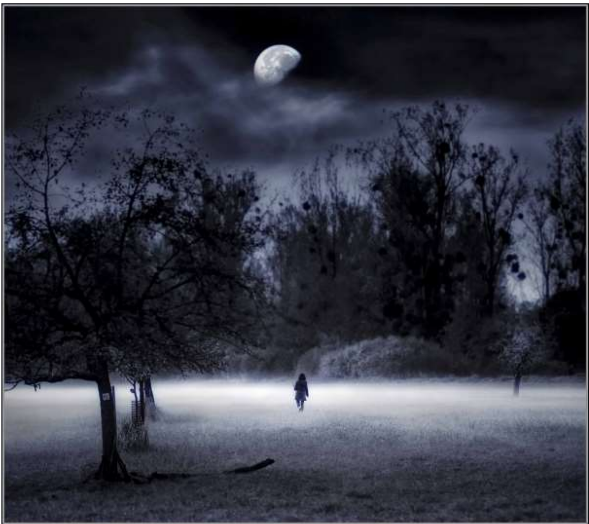
„mondsüchtig“ Bernd Susenburger